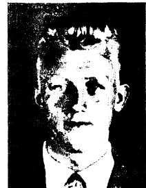
„Die nordische Rasse“, Hans Friedrich Karl Günther „Kleine Rassenkunde des deutschen Volkes“ (1929)