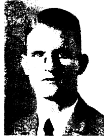
Abb. 6. Merleburg-Stein, Merisch. 1. Porträts eines „Herrn“ für nordische Rasse.

der Universität organisierte Gemeinschaftsvorlesung über Die Judenfrage als plumpe Demagogie im Sommersemester 1943: „Es ist für uns nicht damit abgetan, daß wir die Judenfrage im Reich weitgehend gelöst haben. Sie ist eine Weltfrage, mit der dieser Krieg und seine immer heftiger werdenden Kämpfe zusammenhängen.“