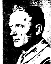
Abb. 7. Niederaden, Merisch. 1. „Herr“.