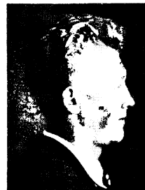
Abb. 8. a, b. Frauen, Merisch mit leichter eisernem Einfluß („Kriegerin“).