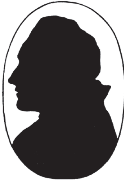
Abb. 3. Lavater liess Goethes Silhouette im ersten Band der Physiognomischen Fragmente (1775) mit folgendem Kommentar abdrucken: „Die nachstehende Silhouette ist nicht vollkommen, aber dennoch bis auf den etwas verschnittenen Mund, der getreue Umriss von einem der größten und reichsten Genies, die ich in meinem Leben gesehen“ (vgl. Judith Steinheider: Schattenbild und Scherenschnitt als Gestaltungsmittel der Buchillustration. Geschichte und Bibliografie . Tectum, Marburg, 2013, 90 sowie Johann Caspar Lavater: Physiognomische Fragmente, zur Beförderung der Menschenkenntniß und Menschenliebe. Erster Versuch . Weidmanns Erben und Reich/Heinrich Steiner und Compagnie, Leipzig/ Winterthur 1775, 223).