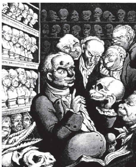
Abb. 2. Satirische Darstellung der Vorlesung Galls aus der Zeit der Verspottung. In Egon Freiherr von Eickstedt: Rassenkunde und Rassengeschichte der Menschheit. Erster Band: Forschung am Menschen. Enke, Stuttgart 1938.