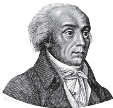
Abb. 1. Johann Friedrich Blumenbach, der Begründer der klassischen Anthropologie