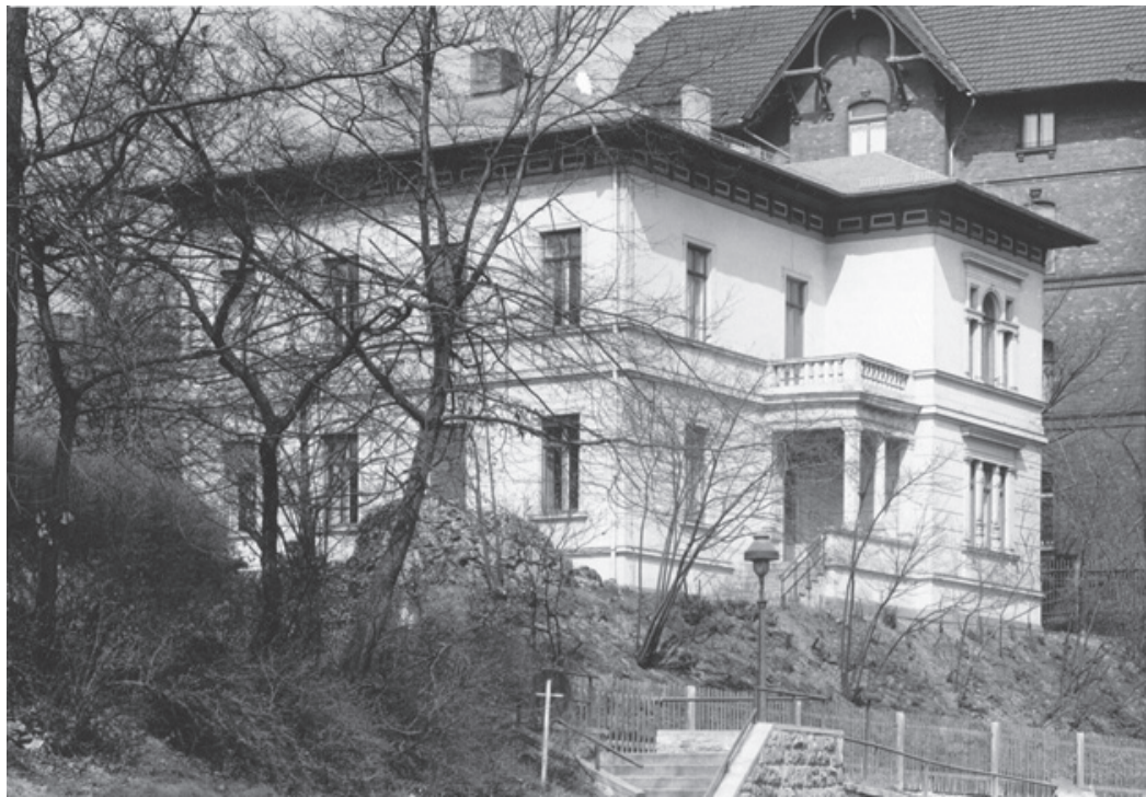
Дом Эрнста Геккеля в Йене

Однако центральное значение для нацистской мировоззренческой интерпретации Геккеля в Третьем рейхе приобрела книга Гайнца Брюхера «Кровное и духовное наследство Эрнста Геккеля» (Brücher, 1936). В предисловии к книге издатель серии Карл Астель (ректор университета в Йене с 1939 г.) сказал: