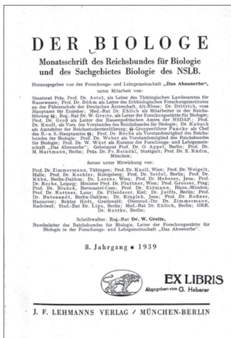
Титульный лист национал-социалистического журнала «Биолог»