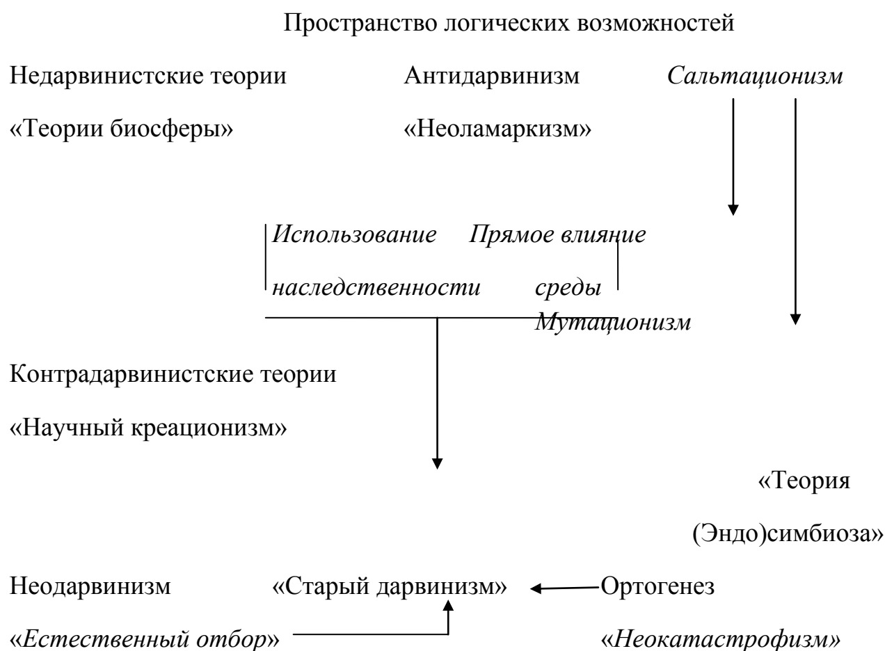
Рис. 1 Пространство логических возможностей. Первая половина двадцатого века была звездным часом АТЭ. При отсутствии детальных описаний эволюционных изменений, биологи говорили о всех мыслимых эволюционных механизмах и их комбинациях, которые мы схематично обрисовали выше (названия научных школ даны в кавычках, а отдельные эволюционные механизмы - курсивом). Появление СТЭ сначала исключило некоторое количество логически приемлемых механизмов и сузило «пространство логических возможностей». Эта схема дает различия между научными антидарвинистскими и контрдарвинистскими теориями, которые попирают самые основы любых форм научного эволюционизма тем, что исключают длительную каузальность в своих механизмах эволюции. Недарвинистские теории предполагают дополнительные эволюционные механизмы (такие как теории, имеющие дело с высшими систематическими уровнями: Zavarazin 2000), которые, в принципе, действуют параллельно с дарвинистскими механизмами, но при определенных обстоятельствах могут войти в противоречие с жестким селекционизмом.